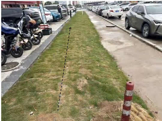
电缆线路迹地现状