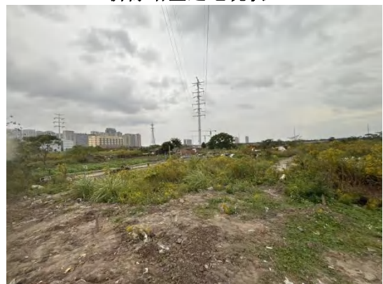
110kV 川门 1559 线/川门备用线双回架空线路