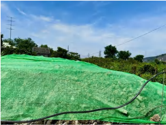
施工期环保措施照片 (土方覆盖防扬尘)