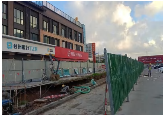
施工期环保措施照片 (设置施工临时围挡)