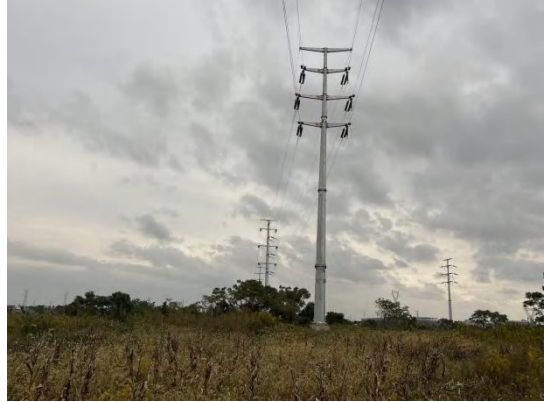
110kV 川门 1559 线/红峰 1639 线双回架空线路 路沿线现状