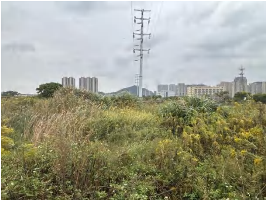
110kV 川门备用线/红峰 1639 线双回架空线路 (预留 1 回) 沿线现状