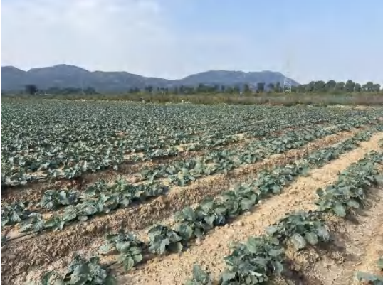
牵张场迹地现状 1 (已复垦)