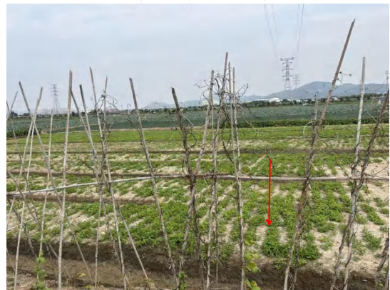
拆除塔基迹地现状 1