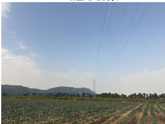
110kV 川盛 1563 线/川文 1556 线双回架空线