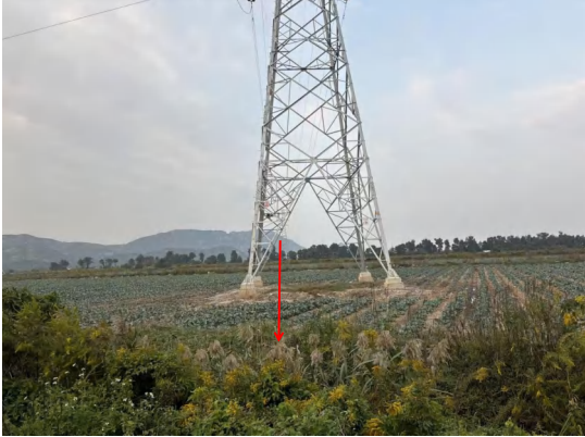
拆除塔基迹地现状 2