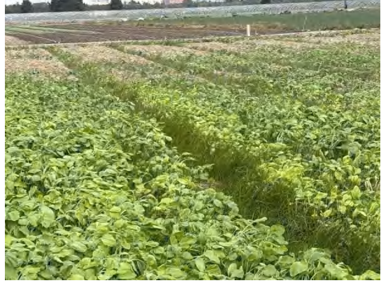
牵张场迹地现状 2 (已复垦)