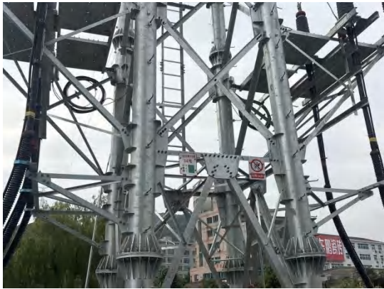
电缆终端塔危险标识